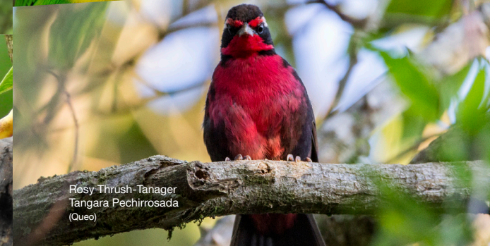
Rosy Thrush-Tanager Tangara Pechirrosada (Queo)