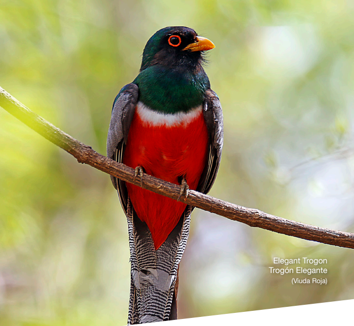
Elegant Trogon Trogón Elegante (Viuda Roja)