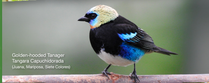
Golden-hooded Tanager Tangara Capuchidorada (Juana, Mariposa, Siete Colores)