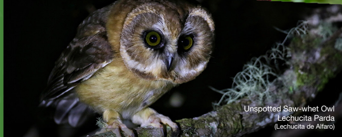
Unspotted Saw-whet Owl Lechucita Parda (Lechucita de Alfaro)