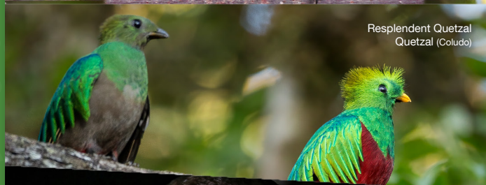
Resplendent Quetzal Quetzal (Coludo)