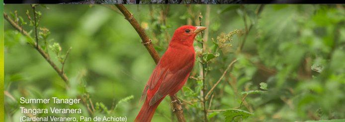
Summer Tanager Tangara Veranera (Cardenal Veranero, Pan de Achiote)