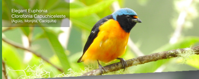
Elegant Euphonia Clorofonia Capuchiceleste (Aguío, Monjita, Caciquita)

The National Bird Route of Costa Rica was developed for bird watchers as a circuit that integrates virtually all of the key birdwatching locations in the country. This provides an experience of great added value, not only because of the grand diversity of bird species, but also because of the local cultures and communities that are part of this route.