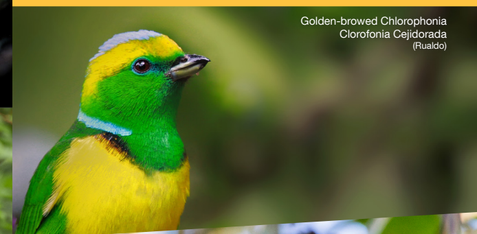
Golden-browed Chlorophonia Clorofonia Cejidorada (Rualdo)

En costa Rica tenemos aproximadamente 51 especies de aves marinas, así como unas 167 especies de aves acuáticas.