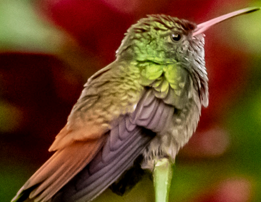
Rufous-tailed Hummingbird Colibrí Rabirrufo (Gorrión)

La Ruta Nacional de Observación de Aves de Costa Rica es una propuesta para observadores de aves (nacionales y extranjeros, especialistas y principiantes) como un circuito turístico que integra prácticamente todo el territorio nacional con puntos y localidades seleccionadas. Lo cual permite una experiencia de alto valor agregado, no solo por la alta diversidad de especies de aves que puede llegar a observar, sino por los complementos de cultura, ruralidad, aventura y comunidades locales que se integran en esta ruta.