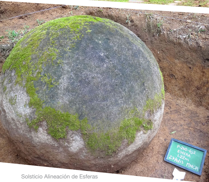
Solsticio Alineación de Esferas