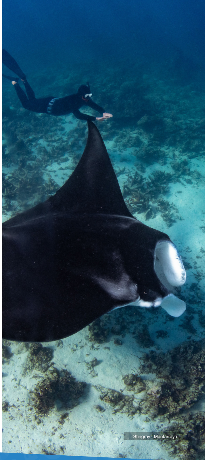
Stingray | Mantarraya