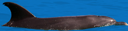
Pantropical spotted dolphin | Juvenil de delfín manchado pantropical

Estos recorridos comprenden desde el hemisferio sur en la Antártida al Pacífico Sur de Costa Rica llegando a finales de julio. Las ballenas del hemisferio norte hacen lo mismo, pero viajan desde Alaska a Costa Rica llegando a finales de diciembre. Viajan entre 5000 km (3100 mi) y 8000 km (5000 mi); dos veces al año.