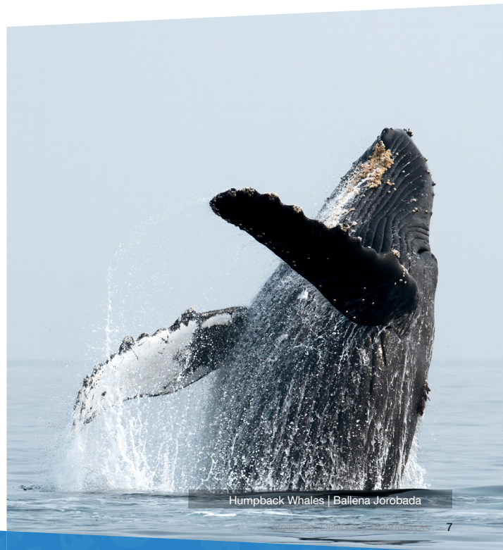
Humpback Whales | Ballena Jorobada

Más información sobre el Festival de Ballenas, Bahía Ballena, Osa: www.facebook.com/FestivalBYDcr