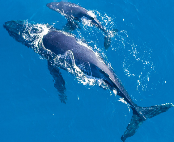
Humpback Whales | Ballena Jorobada