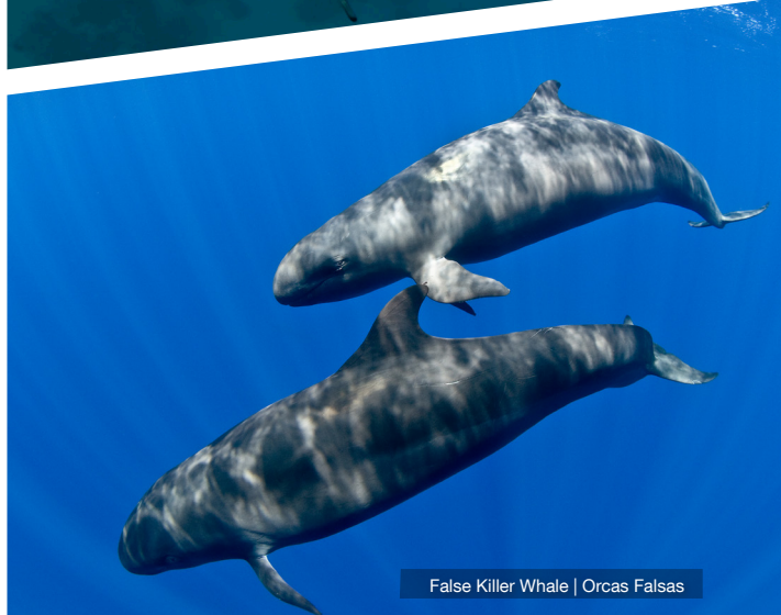
False Killer Whale | Orcas Falsas