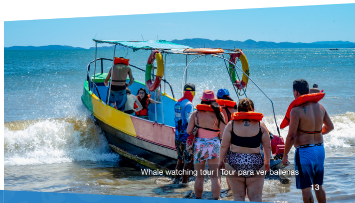
Whale watching tour | Tour para ver ballenas