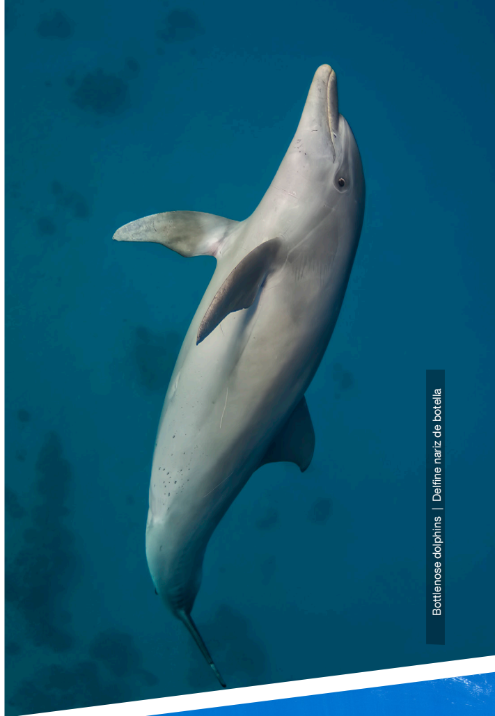
Bottlenose dolphins | Delfine nariz de botella

Los delfines también son muy comunes en Costa Rica, incluso los hay que viven de forma permanente en algunas zonas. Los más comunes son los delfines Mulars ( Tursiops truncatus ) y los Delfines Manchados tropicales ( Stenella attenuata ), especies, ambas, que se encuentran en las aguas costeras y oceánicas durante todo el año. En varios sitios de la costa del Pacífico se producen también encuentros más oportunistas con Orcas Falsas ( Pseudorca crassidens ), Delfines de Dientes Rugosos ( Steno bredanensis ), Orcas comunes ( Orcinus orca ) y ballenas de Bryde ( Balaenoptera edeni ). Se avistan Delfines Giradores ( Stenella longirostris ) y Delfines Comunes ( Delphinus delphis ) en aguas costeras de Osa y la Península de Nicoya.