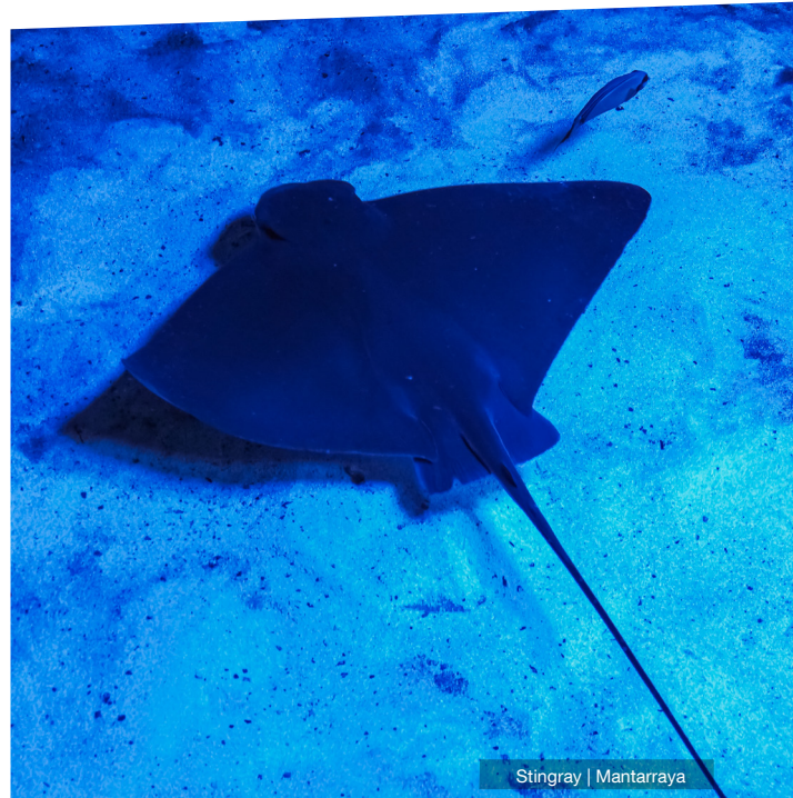
Stingray | Mantarraya

Las mantas oceánicas tienen muy pocos depredadores, su gran tamaño impone respeto y disuade a los depredadores. En cualquier caso, la mantarraya puede nadar lo suficientemente rápido como para intentar escapar de un ataque. Es habitual ver mantas con las alas dañadas, con marcas de mordeduras de tiburón. Estas son señales de que pueden haber escapado a un ataque.