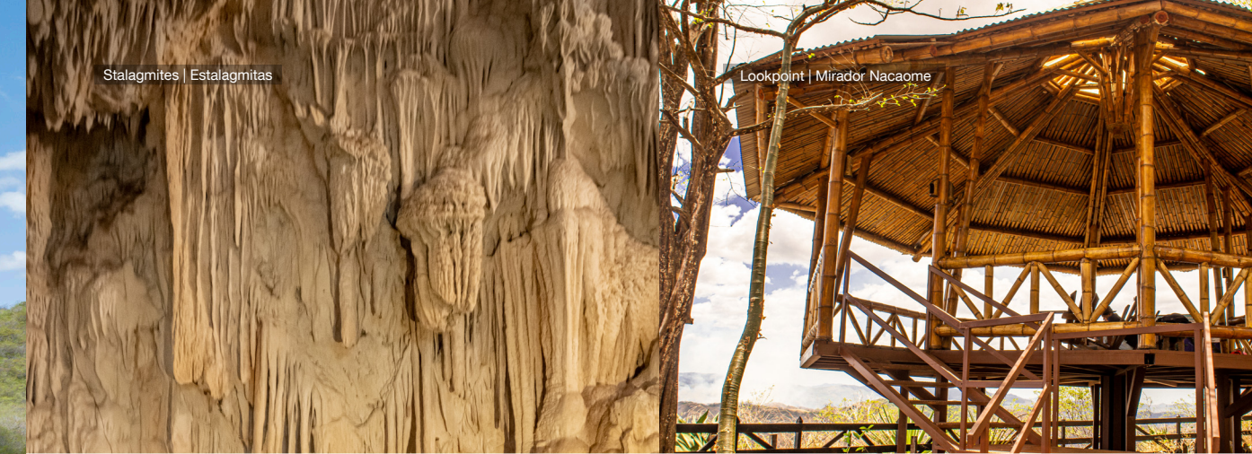
Stalagmites | Estalagmitas