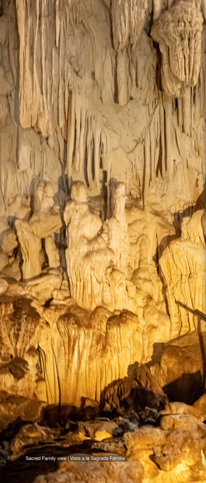
Sacred Family view | Vista a la Sagrada Familia