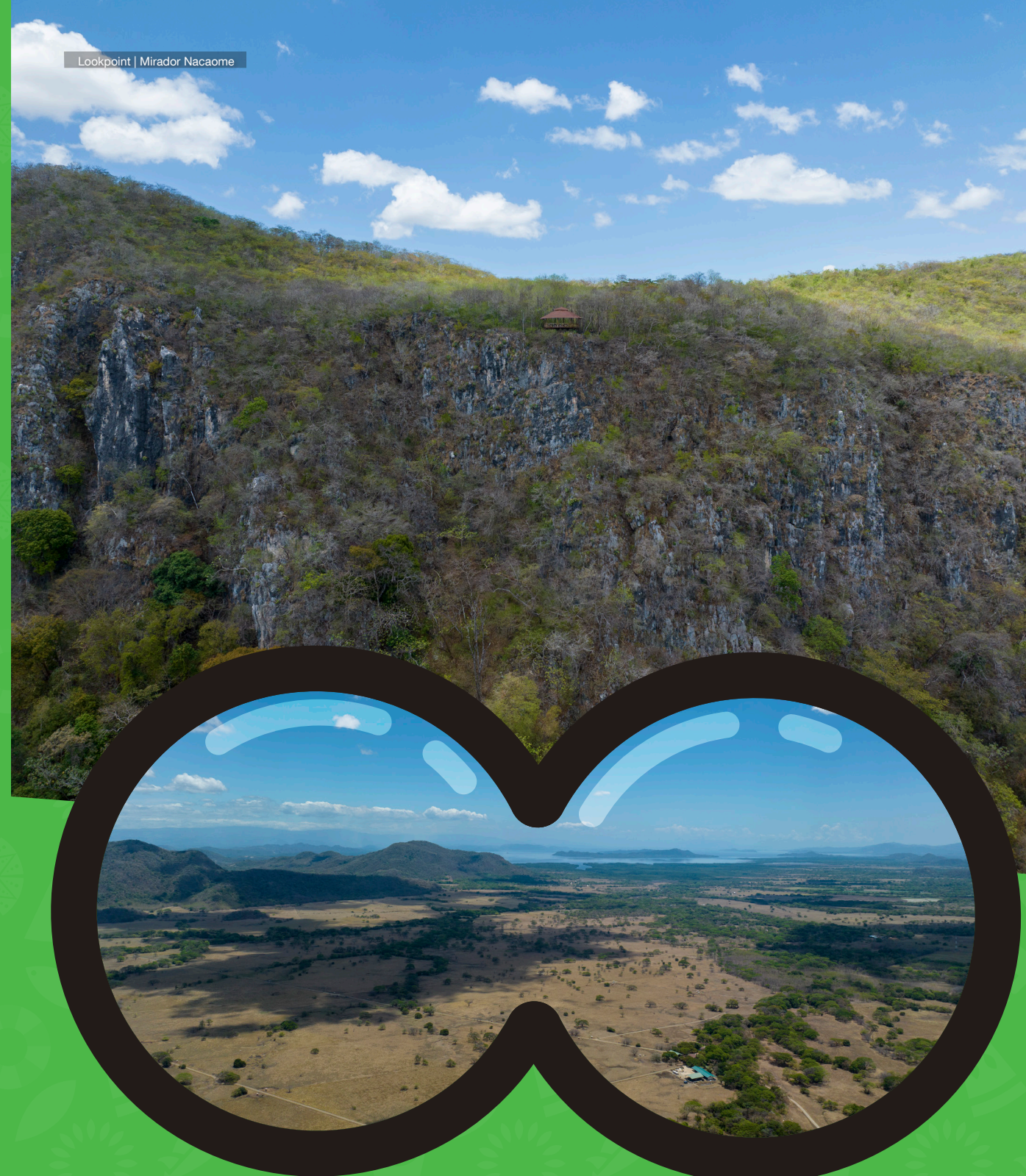
Lookpoint | Mirador Nacaome

Se pueden apreciar mamíferos como monos congos, cariblanco, ardillas, pizotes, mapaches, coyotes, osos hormigueros y armadillos.