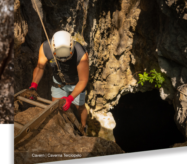
Cavern | Caverna Terciopelo