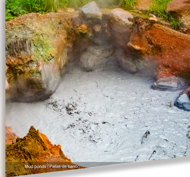
Mud ponds | Pailas de barro