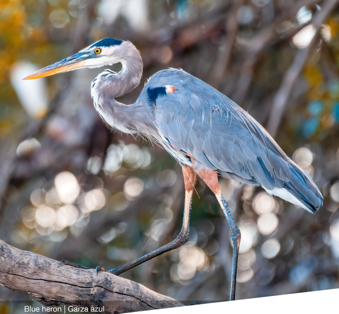
Blue heron | Garza azul