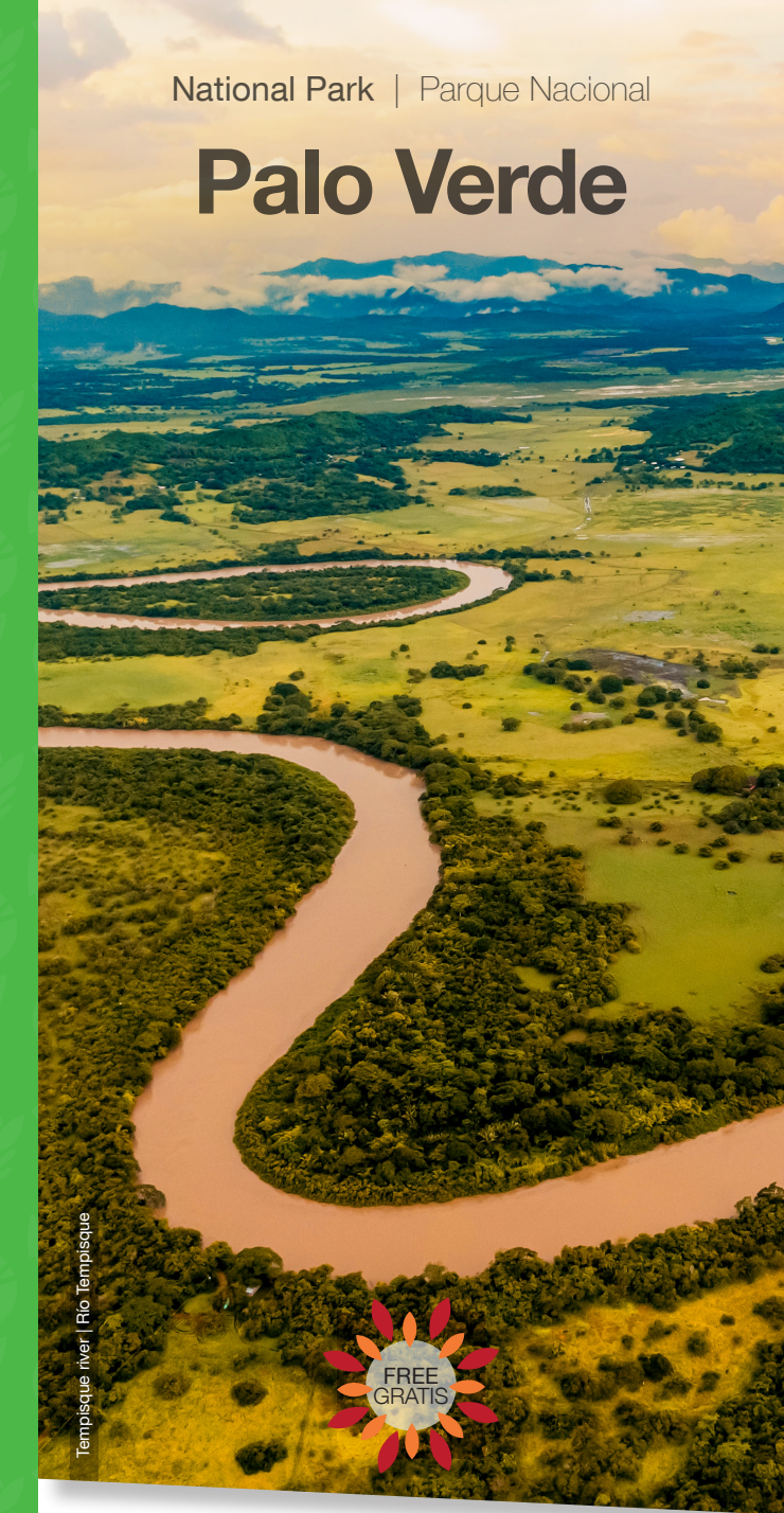
Tempisque river | Río Tempisque