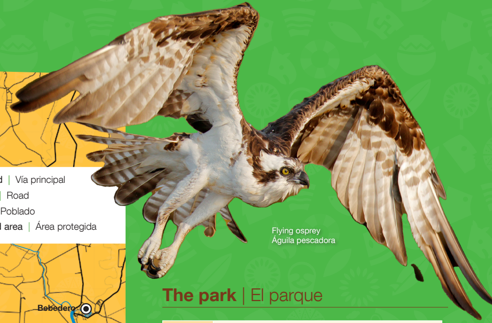
Flying osprey Águila pescadora