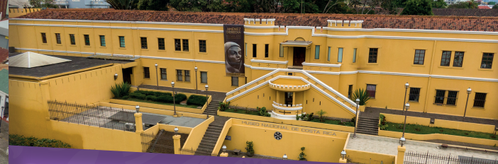
Fotografías: ICT | Art digital

La Urca, costado este del Puente Juan Pablo II. P.O. Box 777-1000 | Tel.: (506) 2299-5800