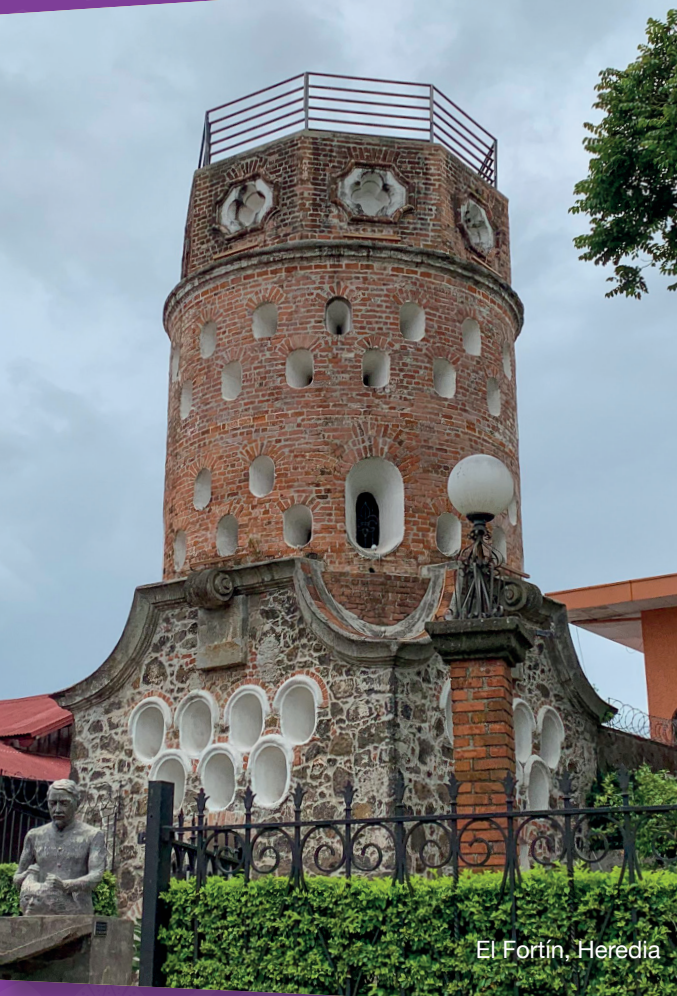
El Fortín, Heredia

Las principales ciudades del Valle Central ofrecen una variedad de servicios comerciales y turísticos de gran calidad. Los pueblos rurales, por su parte, son pintorescos y ofrecen un vistazo de la Costa Rica de antaño, con sus casitas de bahareque (un material de construcción similar al adobe), grandes plantaciones y beneficios de café, trapiches y lecherías.