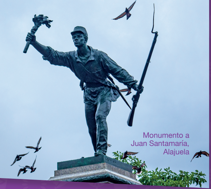
Monumento a Juan Santamaría, Alajuela